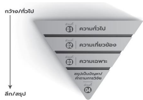
ภาพ 1 การเขียนความเป็นมาของปัญหา

From/BookName/(p./ PageNumber),/by/ Author, A. A./Year,/Publisher/(URL)./ Copyright/Permission.